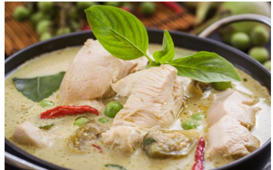
GRÜNES THAICURRY 23.00 mit Pouletbrust-Würfel GREEN THAICURRY with chicken breast