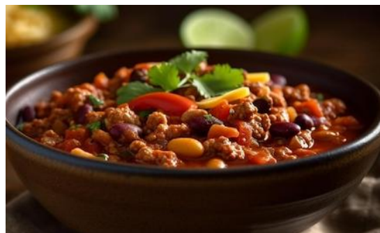
CHILI CON CARNE 21.00