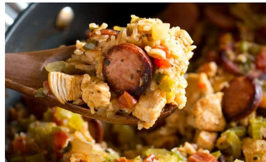
JAMBALAYA mit Wurst & Poulet 25.00 JAMBALAYA with sausage & chicken